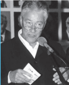
Björn Engholm, Bundesminister a. D.

Anmerkungen zu Geschichte und Gegenwart, Kultur und Ökonomie rund um das Mare Balticum